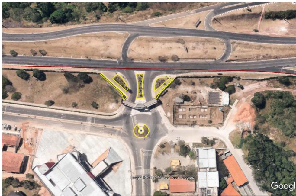
Imagem 02. Vista do Campus São Luís , CCBS, com delimitação das áreas para serviço de manutenção de jardins gramados e bosques com vegetação arbustiva e arbórea.

Imagem 01. Vista do Campus São Luís , entrada principal, com delimitação das áreas para serviço de manutenção de jardins gramados e bosques com vegetação arbustiva e arbórea.