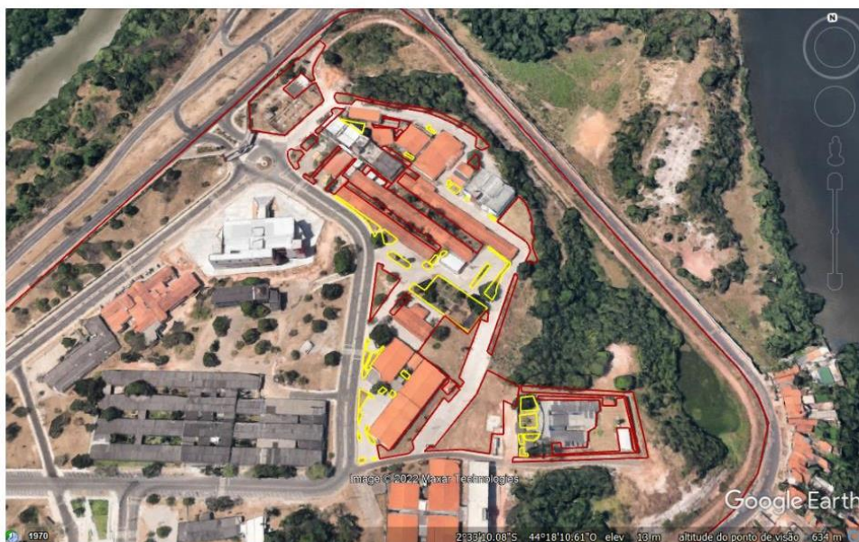
Imagem 03. Vista do Campus São Luís , Pavilhão/Castelão/STI/NEAD, com delimitação das áreas para serviço de manutenção de jardins gramados e bosques com vegetação arbustiva e arbórea.