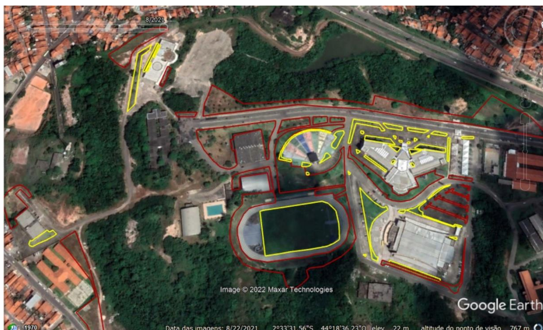
Imagem 08. Vista do Campus São Luís , Empreendedorismo/ Instituto de engenharia I, com delimitação das áreas para serviço de manutenção de jardins gramados e bosques com vegetação arbustiva e arbórea.