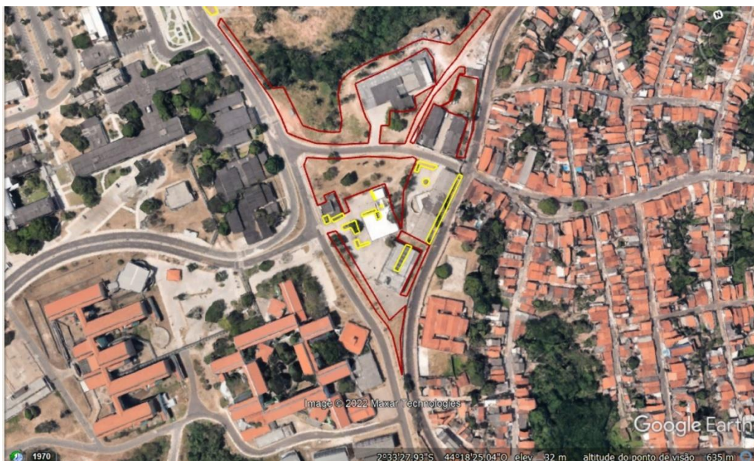
Imagem 05. Vista do Campus São Luís , CCH/CCET/PÓS-CCET/IEE, com delimitação das áreas para serviço de manutenção de jardins gramados e bosques com vegetação arbustiva e arbórea.