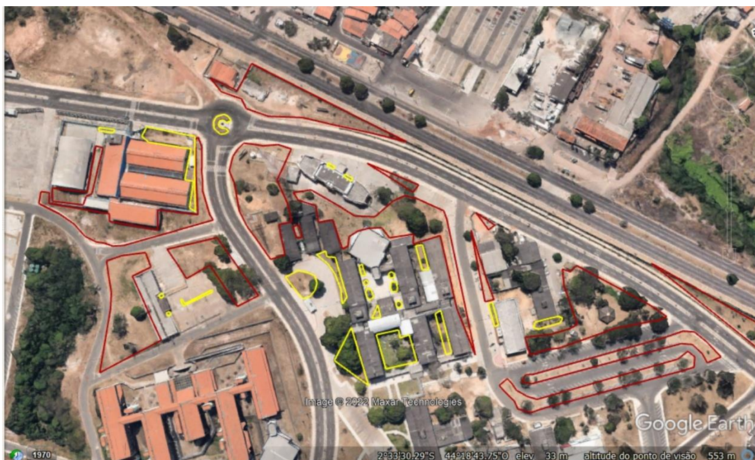
Imagem 07. Vista do Campus São Luís , Paulo Freire/Centro de convenções/Concha/ Núcleo de Esportes/Planetário, com delimitação das áreas para serviço de manutenção de jardins gramados e bosques com vegetação arbustiva e arbórea.