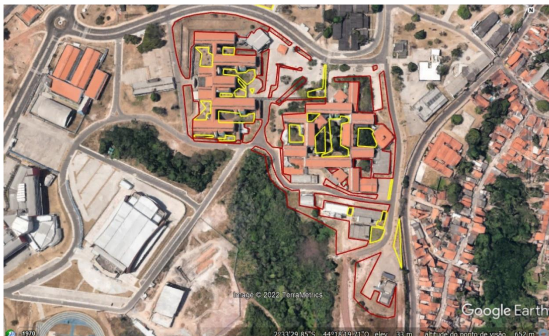
Imagem 06. Vista do Campus São Luís , PÓS-CCH-CCSO/COLUN/CCSO/Rádio/TV UFMA/SINFRA, com delimitação das áreas para serviço de manutenção de jardins gramados e bosques com vegetação arbustiva e arbórea.